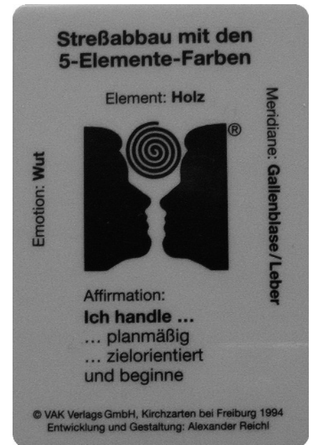
Abb. 1: Beispiel einer Farbkarte vom Element Holz mit Emotion und Affirmation

Hindernisse auf der sozialen Ebene können entstehen, wenn z. B. ein Patient auf Rentenansprüche oder auf die Auszahlung von Unfallversicherungen wartet. Auch wenn ihm dies bewusst ist, kann das Unterbewusstsein u. U. den Heilungsprozess blockieren, aus Angst, sonst leer auszugehen. Jeder Behandler im medizinischen Bereich kennt diese Problematik. Auch hier gibt das neue kinesiologische System dem Klienten konkrete Hilfestellung. Die ausschlaggebenden Emotionen können nicht nur in den Muskeln festgehalten, sondern über den ganzen Körper hinweg verteilt gespeichert sein.